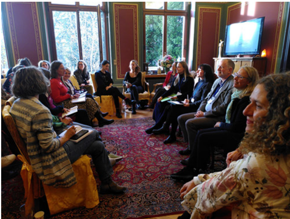
Projektbesuch der EU-Kommission im November 2025